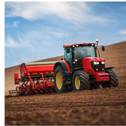
Land- und Baumaschinen